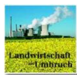
Stromriese und Bauer als Geschäftspartner

BAYREUTH/ARZBERG – Strom kommt bekanntlich nicht bloß aus der Steckdose. Strom kann auch „vom Acker“ kommen – und das zuverlässig, sauber und konstant. Eine Quelle, die sich Eon Bayern in zunehmendem Maße selbst erschließen möchte. 2006 hat das Versorgungsunternehmen, das zu den größten regionalen Energiedienstleistern in Deutschland zählt, deshalb eine „Biogasoffensive“ gestartet. Gefragt und interessant als Geschäftspartner sind für Eon dabei Landwirte auch aus unserer Region.